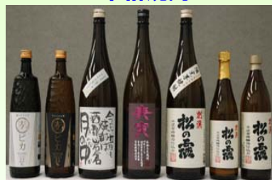
平成宮崎酵母を使用した 本格焼酎