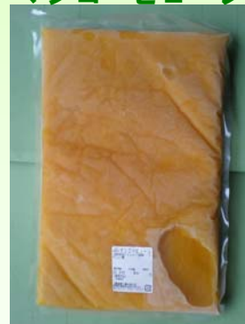
マンゴーピューレ