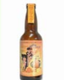
宮崎マンゴー ラガービール