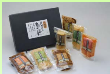
宮崎産天日干し大根 セット