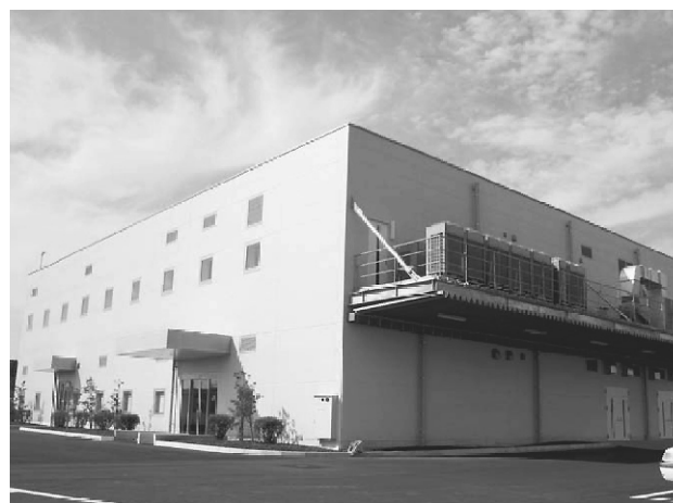
写真2 テクノリサーチパーク内の新工場